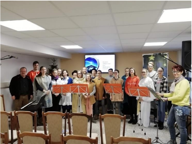
(die Krippenspiel-AG der Saison 2018/19)